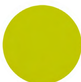
Vert granny VY