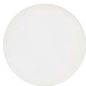
Blanc coton* BG