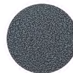
Gris martelé GM