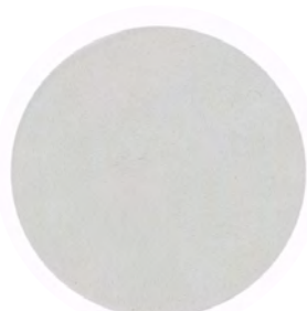
Gris argile* GA