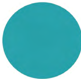
Bleu turquoise ral 5018 VU