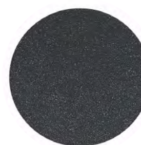
Anthracite janvier* AJ