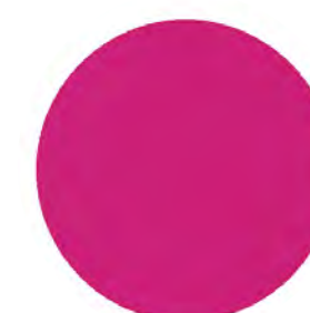
Violet purple VP