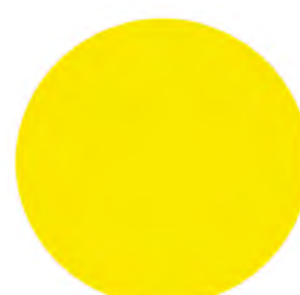
Jaune ral 1023 JA

*Qualité polyester Architecture, ALESTA Ap Grâce à leurs excellentes performances mécaniques ces peintures peuvent être utilisées sur supports métalliques pour architecture intérieure ou extérieure