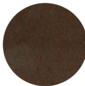
Marron brun givré* MG