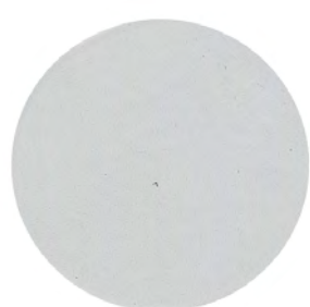
Gris argent GT