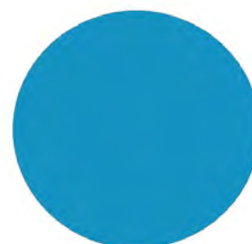
Bleu ciel ral 5015 BI