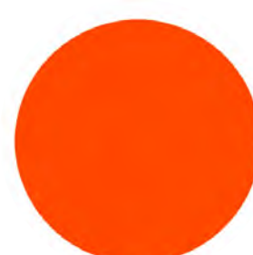
Orange ral 2004* OR