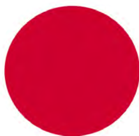
Rouge ral 3000 RG